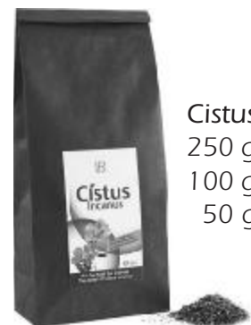
Cistus-Tee, 250 g, 100 g, 50 g

Nicht alle erhältlichen Produkte sind abgebildet.