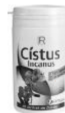
Cistus-Kapseln, 60 Stück