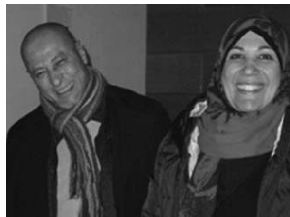
Fröhlicher Besuch aus Ägypten

Und unmittelbar nach dem tanzfreudigen Ausklang der gelungenen Faschings-Sitzung mit abschließender Fußmassage der mittlerweile etwas müde scheinenden Raubkatzenfrau wurden sie und Edeltraud und Margarete vom überaus aktiven Kolpingstüberl-Wirt Christian sogleich für die nächste Veranstaltung engagiert.